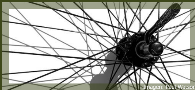
Imagen: Paul Watson

La vuelta a Pedro Bernardo es un pequeño clásico en las rutas de San Esteban del Valle. Dado que transcurre por la vertiente sur de la sierra de Gredos, y no asciende a grandes alturas, es un recorrido apto para todo el año. Tras descender tranquilamente por Mombeltrán hasta Ramacastañas, tomaremos el suave trazado de la CL-501 (a San Martín de Valdeiglesias), a escasa distancia del río Tiétar. Tras pasar por Lanzahíta, tomamos el desvío a Pedro Bernardo y, tras 22 km de tendida pero constante subida, coronamos el puerto del mismo nombre, quedando San Esteban del Valle a nuestros pies.